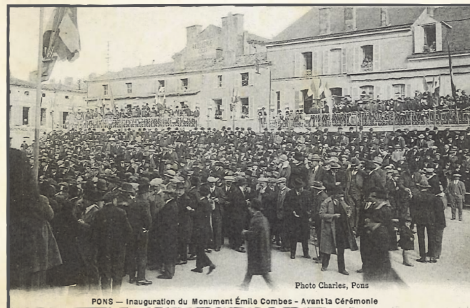
Photo Charles, Pons PONS — Inauguration du Monument Émile Combes - Avant la Cérémonie

Du haut de ses 33 mètres le Donjon de Pons est sans conteste le plus imposant de la région.